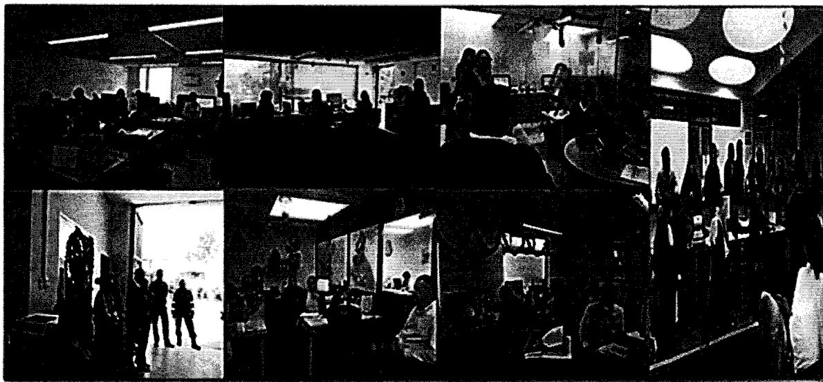
Fuente: Informe "La hora del Control Interno" – Oficina Asesora de Control Interno, 20-dic-16