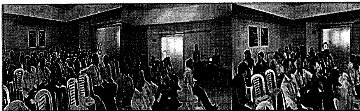
Fuente: Informe "La hora del Control Interno" – Oficina Asesora de Control Interno, 20-dic-16