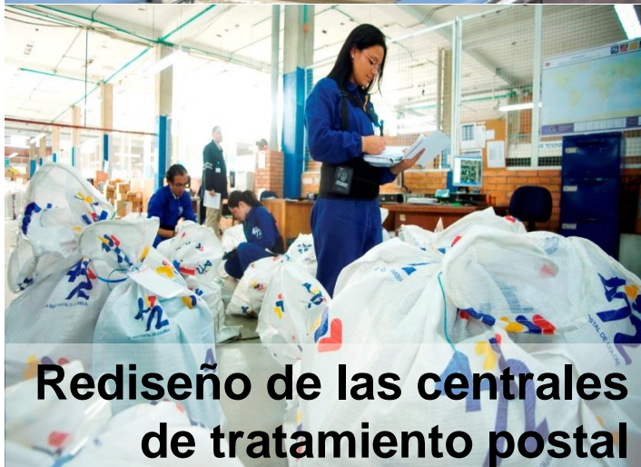
Rediseño de las centrales de tratamiento postal