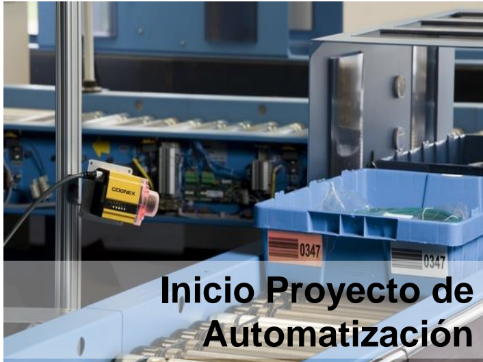
Inicio Proyecto de Automatización