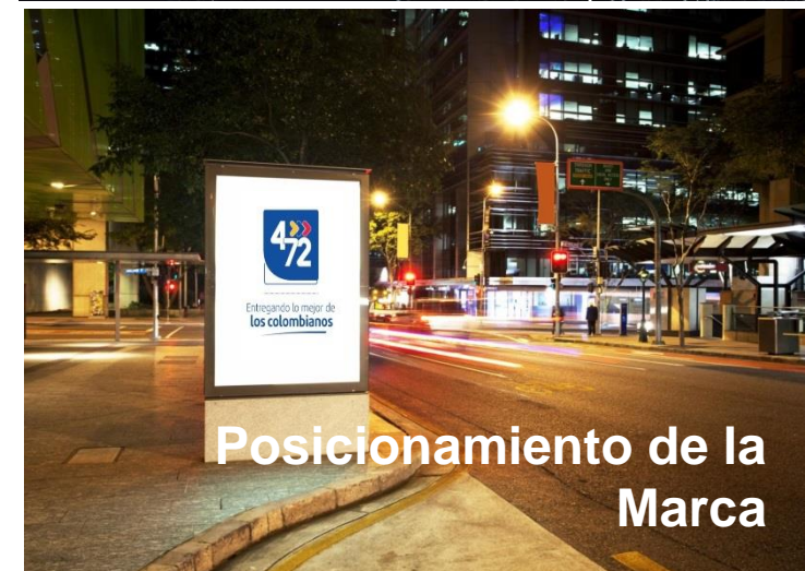
Posicionamiento de la Marca